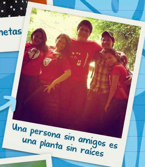
Una persona sin amigos es una planta sin raíces