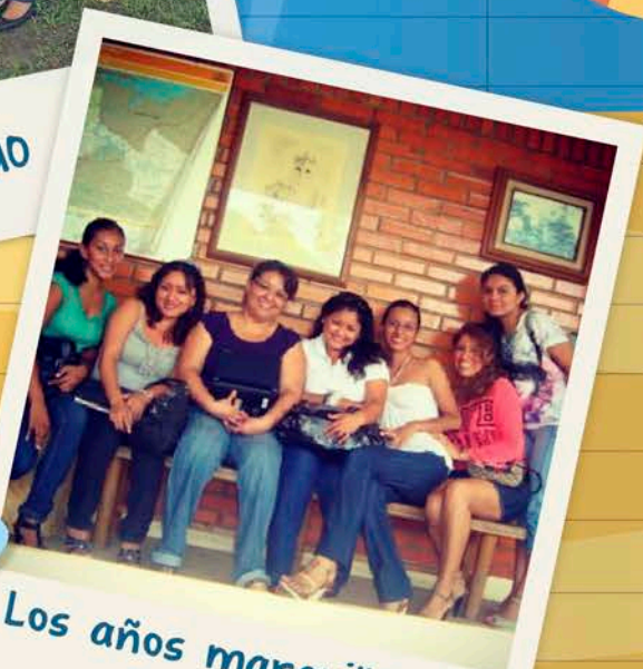
Los años maravillosos en la UO