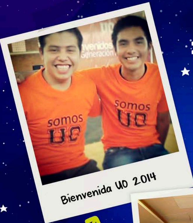
Bienvenida UO 2014

Las imágenes deberán reunir los siguientes requisitos: Alta resolución, título de la foto, mencionar si se es alumno, egresado, docente o administrativo, y coordinación académica o área a la que pertenece.