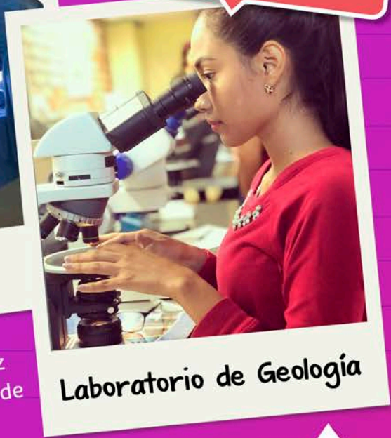
Laboratorio de Geología