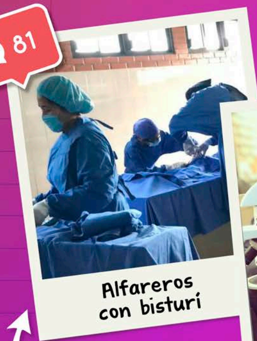
Alfareros con bisturí