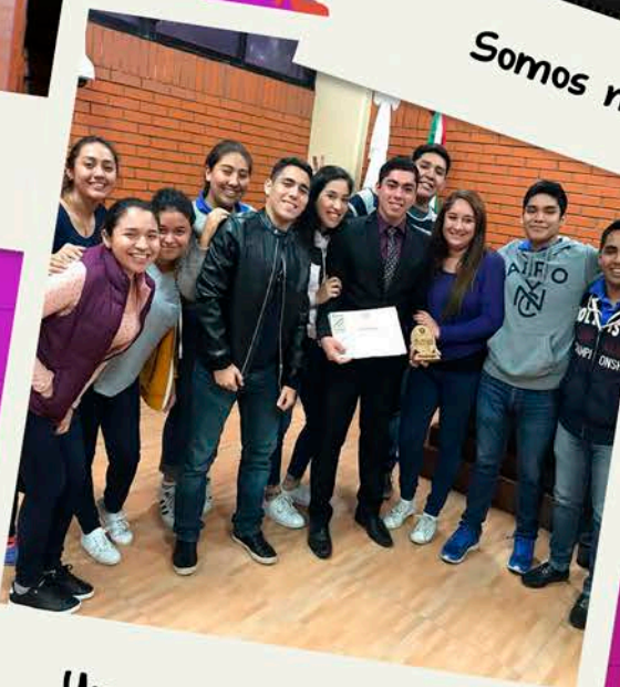
Una gran amistad :)