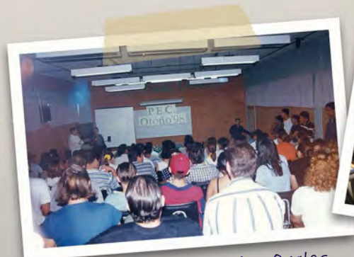
Sala de Juicios Orales