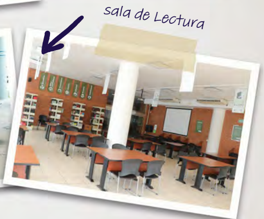
sala de Lectura