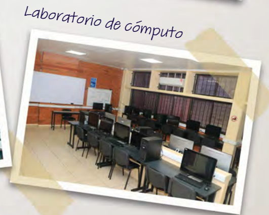
Laboratorio de cómputo